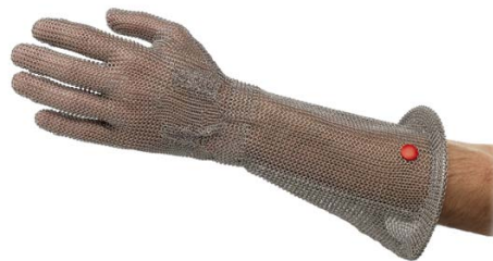
Gant avec manchette « STOPLAME » Glove with « BLADE-STOP » cuff