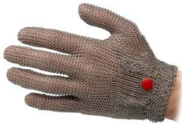
Gant sans manchette Glove without cuff