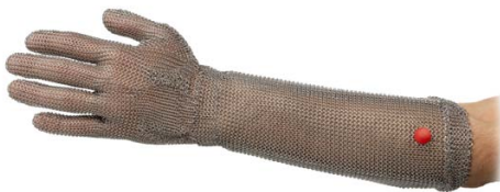
Gant avec manchette 20 cm Glove with 20 cm cuff