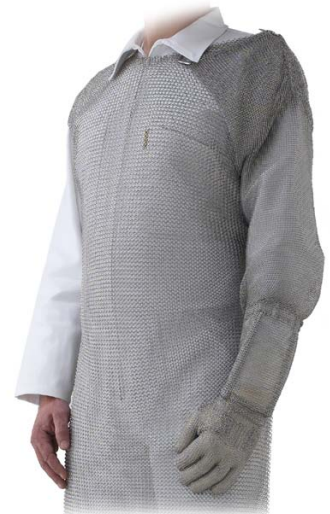
Gant épaule Shoulder glove

Tous nos gants sont vendus à l'unité All gloves are sold by 1 unit