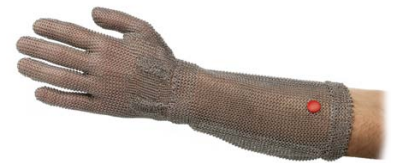
Gant avec manchette 15 cm Glove with 15 cm cuff