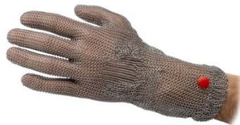
Gant avec manchette 7,5 cm Glove with 7,5 cm cuff